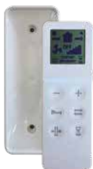
Telecomando e base di supporto